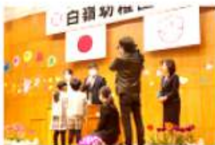
この模様はMROテレビと北國新聞の朝刊にもとりあげられました。

寄贈したのはリベックスさん。島町チ169で、マスク不足の深刻化に一役担おうと、繊維製品の技術を活かしマスク生産に着手し、この度、製品化できたマスクを、まずは地域のために貢献したいと寄贈したものです。