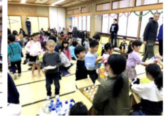
↑休憩（おやつタイム）